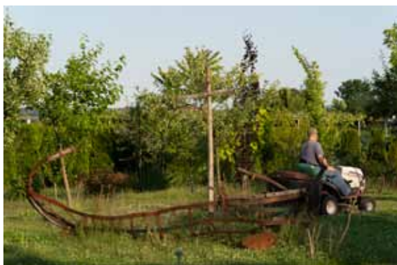
Robert Jurak ODISEJEVA BARKA, 2019