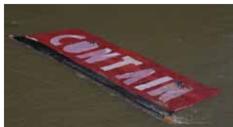
Ren Aldridge CONTAIN CONTROL, 2019